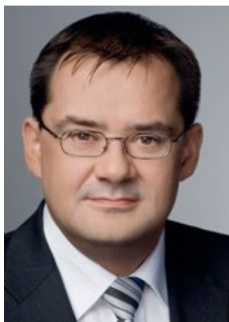
Minister Jörg Vogelsänger

Ministerium für Ländliche Entwicklung, Umwelt und Landwirtschaft des Landes Brandenburg (angefragt)