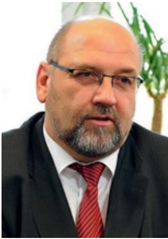
Minister Harry Glawe

Ministerium für Wirtschaft, Arbeit und Gesundheit des Landes Mecklenburg-Vorpommern