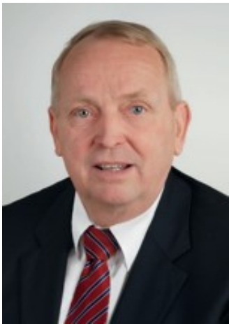
Minister Dr. Till Backhaus

Ministerium für Wirtschaft, Arbeit und Gesundheit des Landes Mecklenburg-Vorpommern