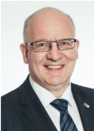
Oberbürgermeister Roland Methling

Ministerium für Ländliche Entwicklung, Umwelt und Landwirtschaft des Landes Brandenburg (angefragt)